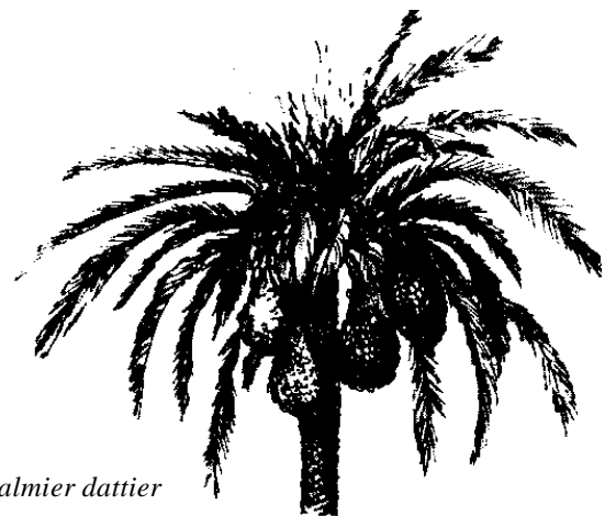
un palmier dattier